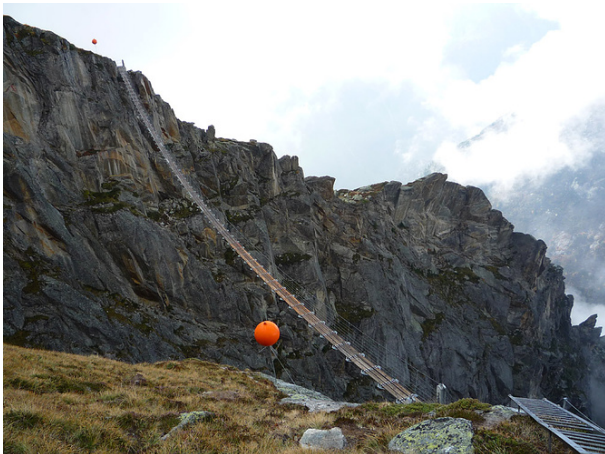
Salbit-Brücke 90 Meter lang